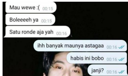
Gambar 2: Contoh percakapan sebelum imagine dan plotting

merasakan morning wood atau seperti yang dilansir dari Alodokter (2023) memiliki arti kondisi ketika penis mengalami ereksi di pagi hari bahkan jika tanpa adanya rangsangan yang disengaja. Berikut adalah contoh ketika keduanya akan melakukan imagine dan plotting .