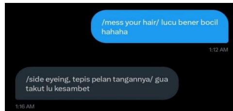
Gambar 3: Contoh imagine oleh V

mengabarkan kegiatan sehari-hari saja maka hal tersebut dapat membuat dirinya merasa bosan dengan mudah.